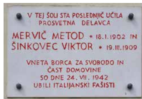
Spominska plošča na stavbi, v kateri je bila šola.

V Bečajevi Kroniki je zapisano: »Pridi Bečaj pomagat pokopavat, Italijani so pobili vse fante, nekaj mož in tudi oba učitelja ...«