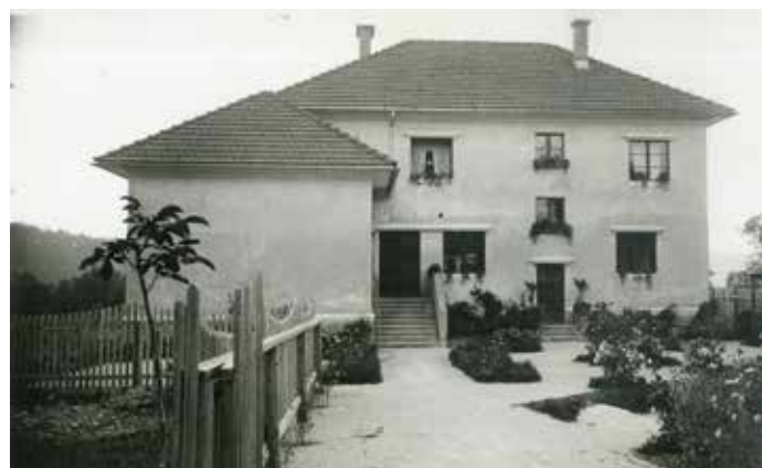
Gorenje Otave, Državna ljudska šola.

V šolskem letu 1935/36 se je pouk začel 4. septembra 1935, 6. decembra so priredili Miklavžev večer, na katerem so obdarili vse otroke. Božični šolski odmor je trajal od 13. decembra 1935 do 11. januarja 1936, velikonočni od 9. do 20. aprila 1936. Šolsko leto se je zaključilo 27. junija 1936.