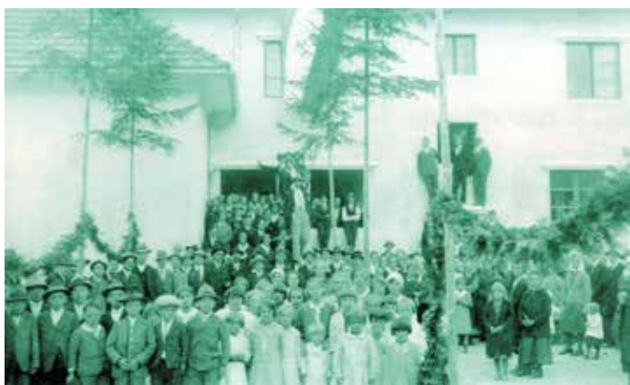
Odprtje šole Gorenje Otave, 15. 10. 1933