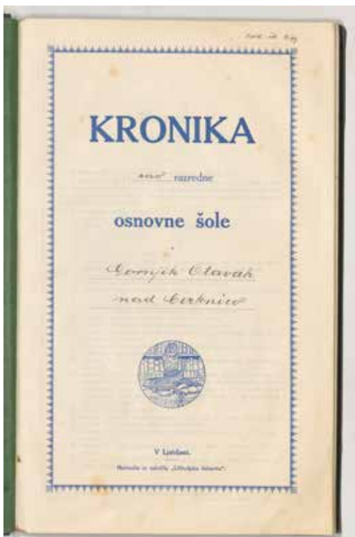
Naslovna stran kronike, hrani Zgodovinski arhiv Ljubljana.