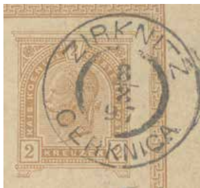
Sl. 7: Poštni žig iz leta 1897, zbirka KJUC