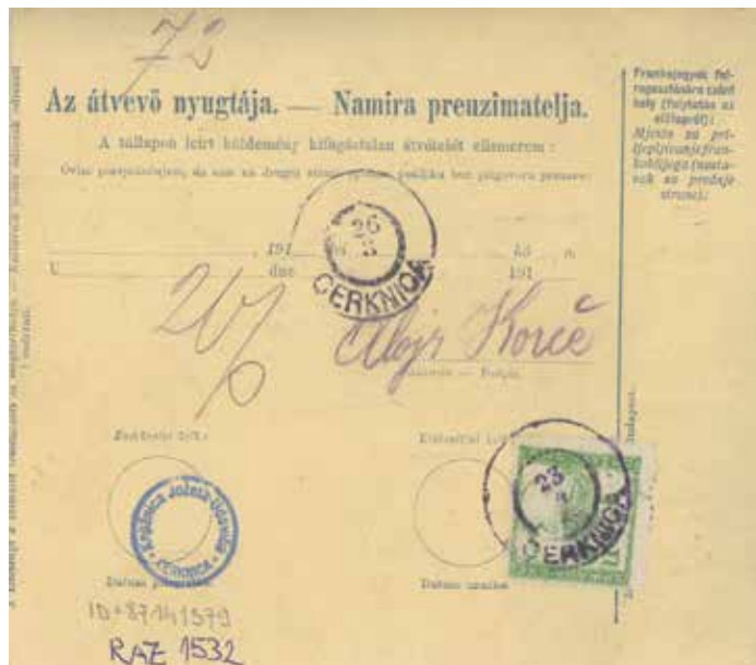
Sl. 13: Odpremnica, mere 12 x 14 cm, zbirka KJUC

izročena 21. 12. 1883, C(esarsko) kr(aljeva) pošta s podpisom poštnega uradnika Zagorjana jo je datirala z 31. 12. 1883. Završnik je v Trst (Terst, Triest), Ljubljano, Dunaj, Maribor (Marburg), Prago, Zagreb, Stično (Zatičina), Pivko (St. Peter), Snežnik (Schneeberg), Sodražico (Sodrašca), Prezid, Čabar (Čubar) ... pošiljal pisma z denarjem, poštne nakaznice ter pakete: »zavitek usnja, prazen sodček, košaro mesa, zabojček rib, telečjo kožo, balo kož, zavitek teletine, kišco mesa, korbco mesa, 2 zajca, jack leader, paket mesa ...« Meso je pošiljal v zimskih mesecih. Pri vsaki oddaji sta bila poleg »stvari«, ki jih je Završnik pošiljal, imen in priimkov prejemnikov, krajev, vrednosti tudi podpis poštnega uslužbenca Zagorjana in žig pošte.