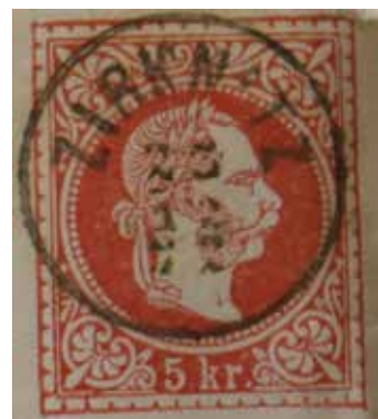
Sl. 6: Poštni žig, Cerknica, 1872 (NUP, Gerbičeva zapuščina)