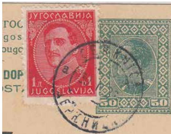
Sl. 10: Poštni žig iz leta 1932