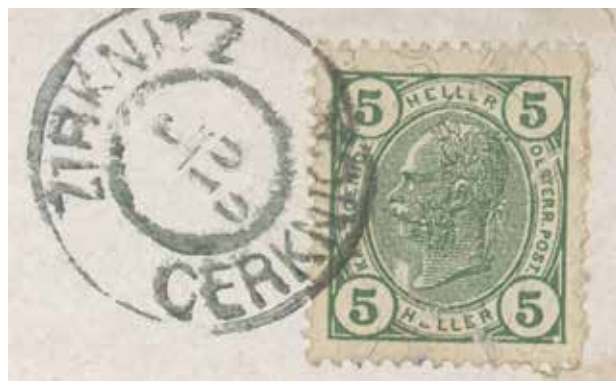
Sl. 8: Poštni žig iz leta 1906, zbirka KJUC

nanjo spominjajo štiri zamrežena okna v pritličju in zazidana reža za pisma. Zaposlenih je bilo več poštних uslužbencev. Zagorjan je uredil tudi poslopje za dve poštni kočiji in hlev, v katerem je bilo v najboljših časih pet konj. S kočijama so poleg poštних pošiljk prevažali tudi potnike. Kočijaž je v poštni rog v Cerknici zatrobil trikrat: pred mostom, v centru in takrat, ko je naselje zapuščal.