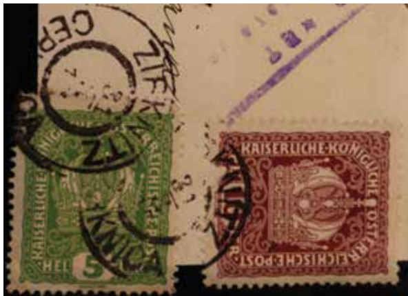
Sl. 9: Poštna žiga iz leta 1917, zbirka KJUC