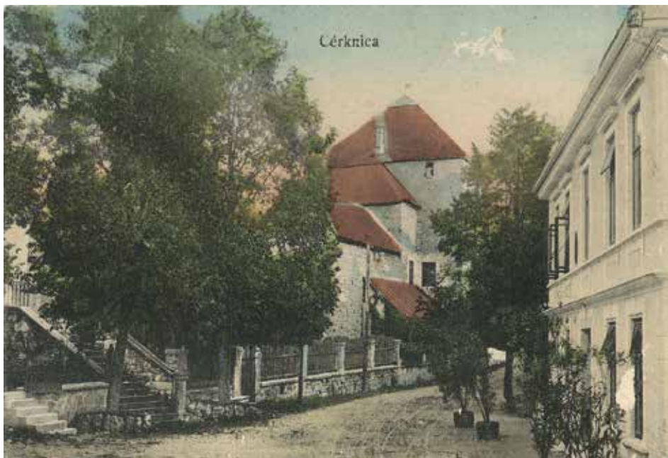
Sl. 2: Na desni Zagorjanova hiša na Taboru, v kateri je delovala pošta, razglednica odposlana 1916, zbirka KJUC.