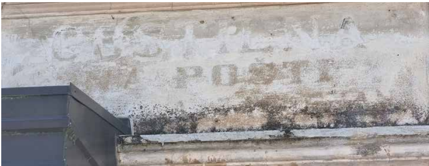
Sl. 3: Še vedno viden napis na Zagorjanovi hiši: Gostilna na pošti (© MH)