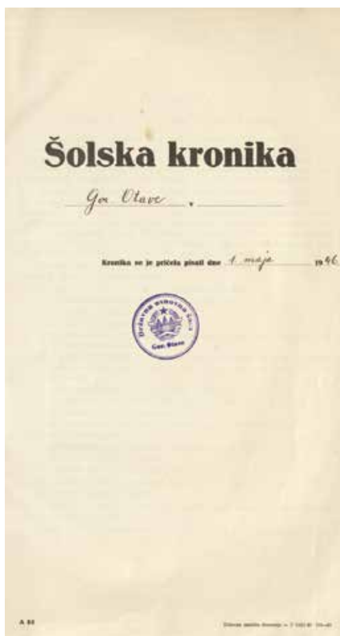
Naslovna stran kronike (ZAL)

Vir: Šolska kronika OŠ Gor. Otave (1945–1962)