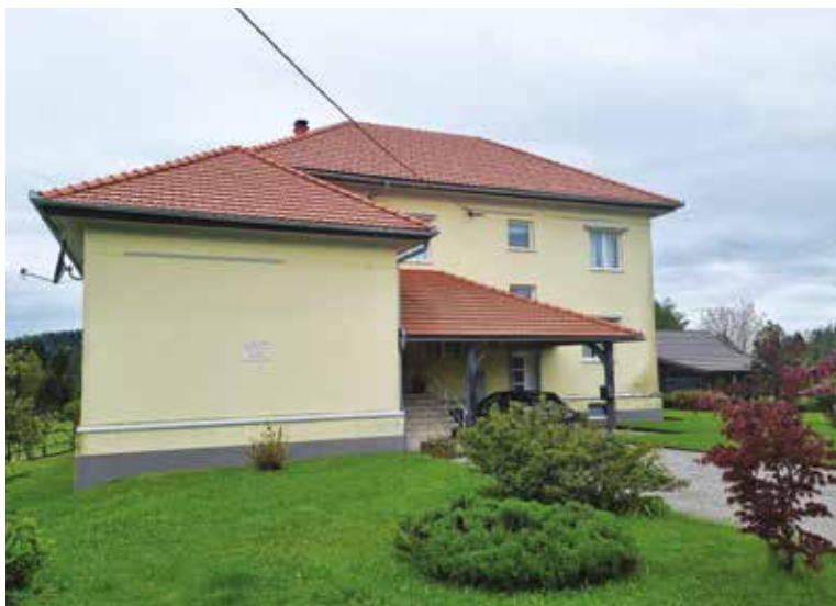
Današnji pogled na nekdanjo otavsko šolo