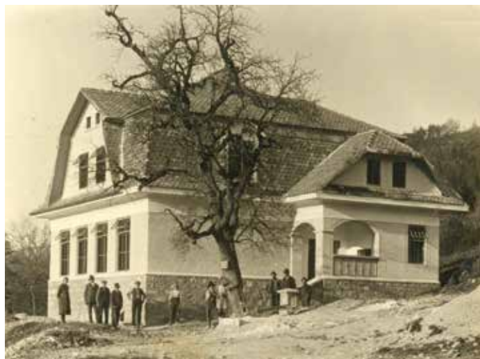
Sl. 2: Osnovna šola Gorenje Jezero okrog leta 1928 še brez napisa na pročelju, hrani Knjižnica Jožeta Udoviča Cerknica (KJUC).