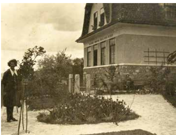
Sl. 3: Osnovna šola Gorenje Jezero, trideseta leta 20. stoletja, šola z napisom Državna osnovna šola Gorenje Jezero ima urejeno okolico, hrani KJUC (© MH).