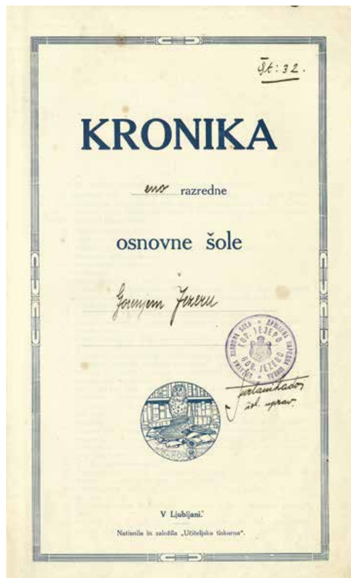
Sl. 4: Kronika osnovne šole Gorenje Jezero od šolskega leta 1935/36 do 1963, hrani Zgodovinski arhiv Ljubljana.