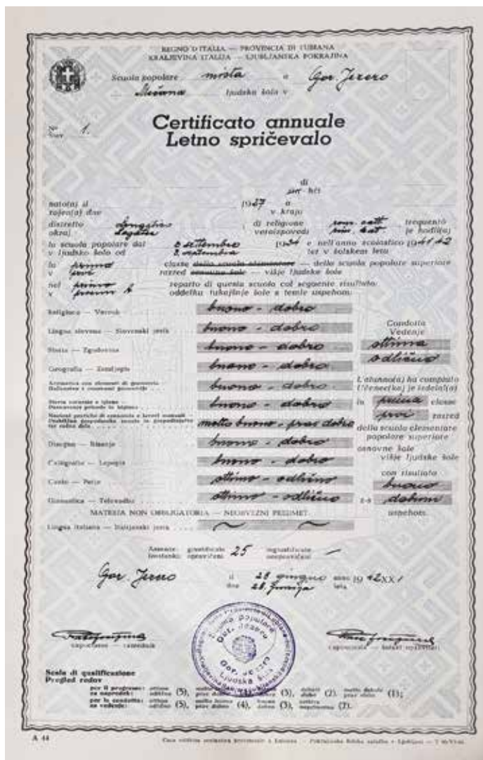
Sl. 5: Dvojezično šolsko spričevalo iz časa italijanske okupacije, 28. junij 1942, hrani ZAL (© MH).

Vir: Kronika osnovne šole Gorenje Jezero od šolskega leta 1935/36 do 1963, dokumenti o šoli, hranita ZAL in SŠM.