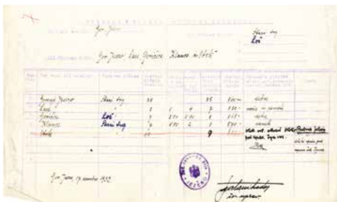
Pregled k načrtu šolskega okoliša, 17. december 1932, hrani SŠM.

v zapisu navedel, zakaj so zahtevali šolo: »Ker so imeli Otočani do šole okoli 5 km, so vložili prošnjo za ustanovitev ekskurence na Otoku. Prošnja jim je bila odbita z odlokom deželnega šolskega sveta z dne 11. oktobra 1905. Otočani so se pritožili na ministrstvo za uk in bogočastje na Dunaju, ki jim je naposled dovolilo ustanovitev ekskurendne šole (manjša šola, v kateri le nekajkrat tedensko poučujejo učitelji z matične šole, op. a.), katera je bila odvisna od šole v Starem trgu. S poukom se je pričelo 2. aprila 1906.« Pouk je potekal dvakrat tedensko, ob ponedeljkih in četrtnih, v hiši št. 6 (zdaj 7), nekdanj Jurjevi. V šolskem letu 1906/07 je bilo vpisanih 20 otrok, 1907/08 pa 21. Kot nagrado za poučevanje je učitelj prejemal dodatnih 600 goldinarjev letno. Dne 29. julija 1908 je bilo sklenjeno, da se na Gorenjem Jezeru ustanovi enorazredna direktivna šola, ki bo skrbela tudi za pouk ekskurendne šole na Otoku. Dne 30. maja 1921 je enorazrednica na Gorenjem Jezeru zopet prišla pod vodstvo starotrške šole in je ponovno začasno postala ekskurendna šola s poukom dvakrat tedensko. Podobno je bilo s šolo na Otoku, kjer se je pouk začel 15. junija 1921.