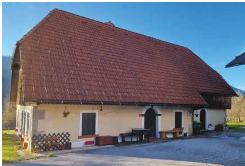
Šola je na Otoku delovala v tej hiši do leta 1942.